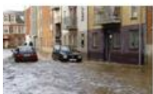
Beskyt vores by