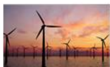
Grøn energi og varme