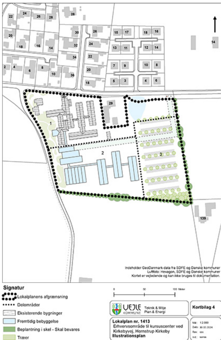
Figur 2: Illustrationsplan.