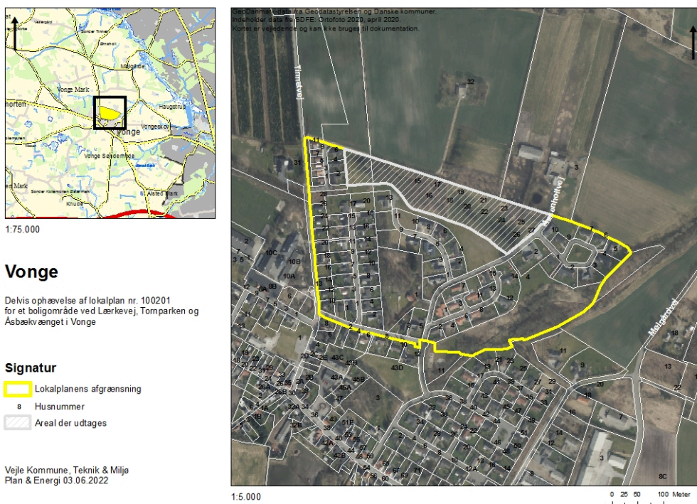
Figur 1: Kort over lokalplanområdet og det konkrete areal der ønskes udtaget af lokalplan nr. 100201.