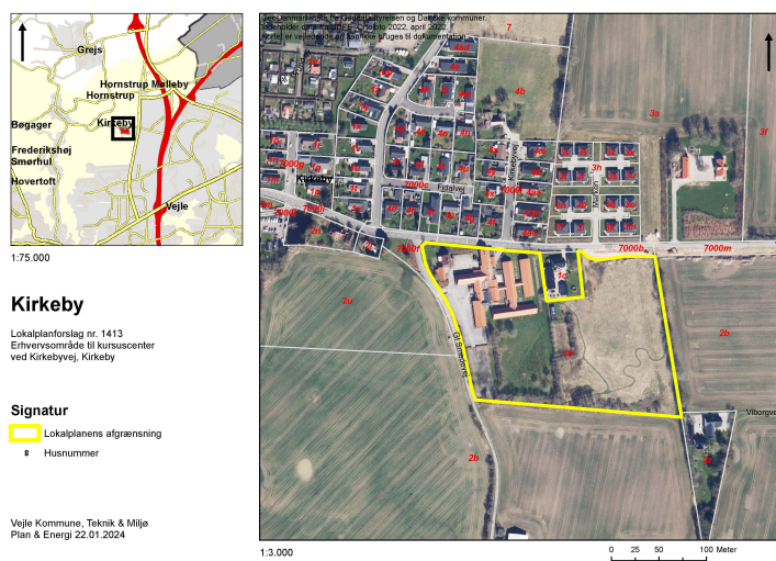
Figur 1: kort over lokalplanområdet.