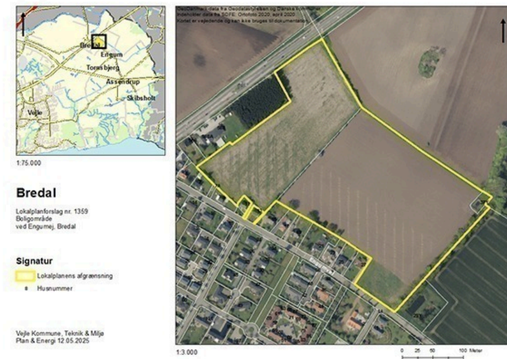
Figur 1: Kort over lokalplanområdet