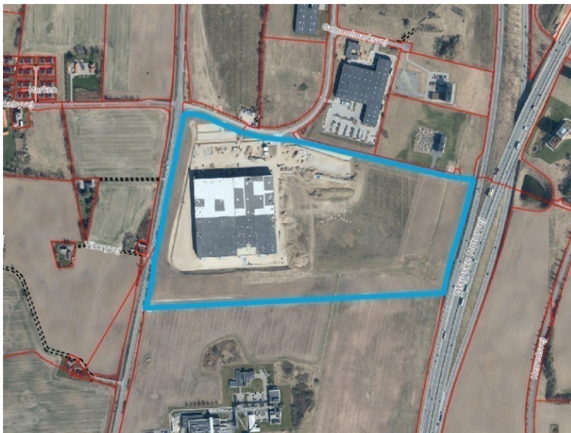
Figur: Gammelmarksvej 41, april 2025

Frode Laursen har bygget 1. og 2. etape af deres nye logistikcenter på Gammelmarksvej 41 i Vejle Nord.