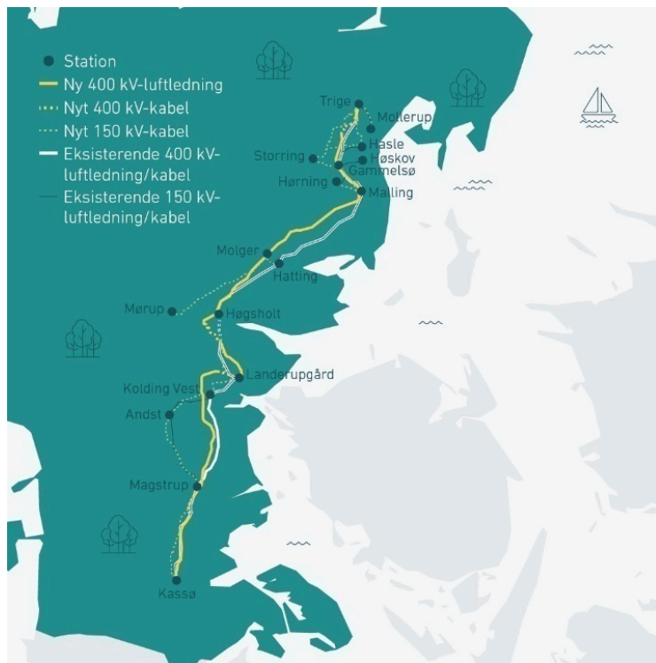
Figur 1: Kort over eksisterende og kommende ledninger

Parallelt gennemføres et særskilt 150 kV-projekt, hvor omkring 270 km luftledninger erstattes af kabler. I Vejle Kommune indebærer det blandt andet en ny transformerstation i Mørup, som kræver lokalplan.