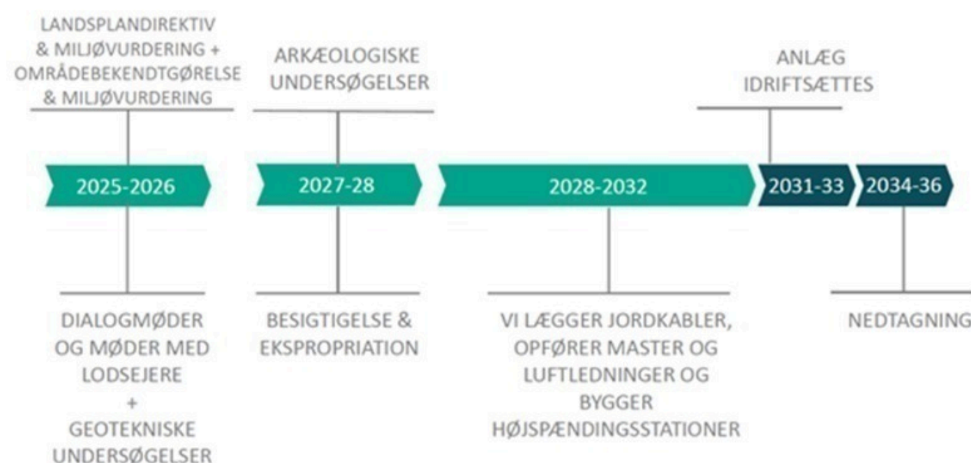
Figur 1: Figuren viser tidsplan fra Energinet