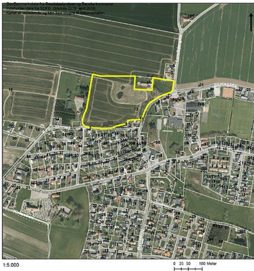
Figur 1: kort over lokalplanområdet