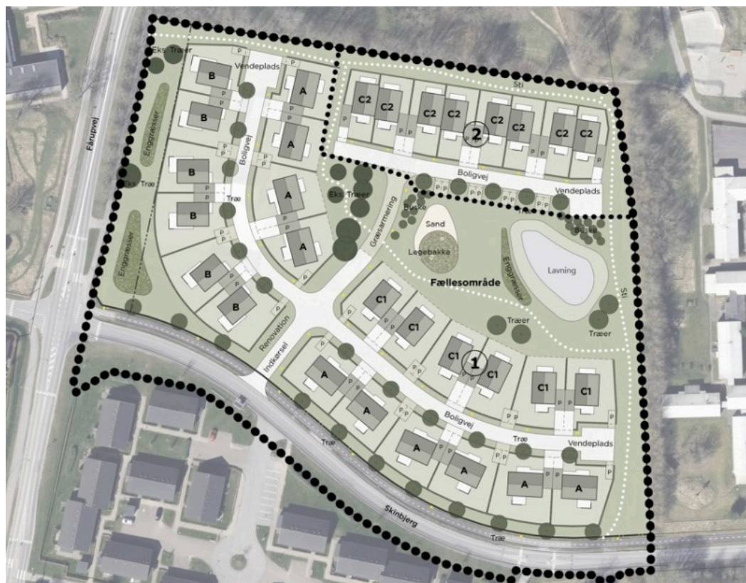
Figur 3: Kortbilag 4 Illustrationsplan