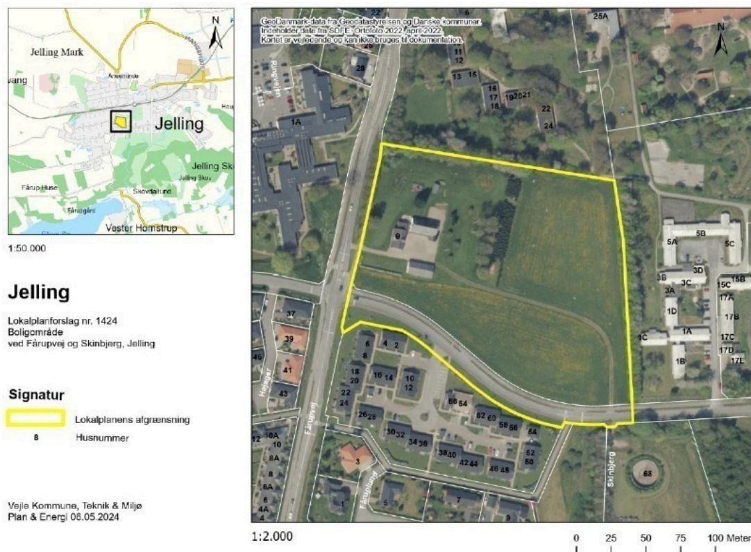
Figur 1: Kort over lokalplanområdet