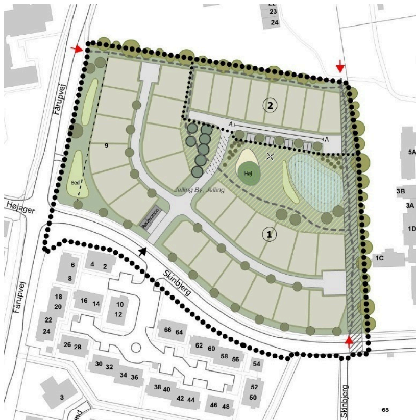
Figur 2: Kortbilag 3 Fremtidige forhold