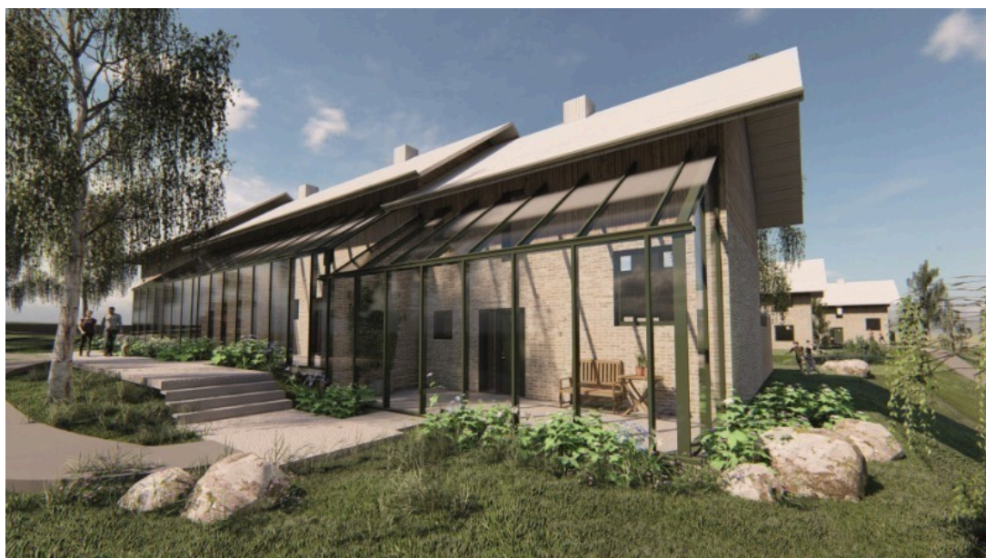
Figur 2: Visualisering af bolig med facadeskærm, hvor rummet mellem skærm og facade kan indrettes til ophold.

Det har været et ønske fra bygherre, at facadeskærmen skal kunne bidrage til kvaliteten af den enkelte bolig. Bygherre vil derfor gerne, at skærmene udformes, så det fremstår som orangeri. Facaden bliver derved sikret mod støj, ligesom den enkelte beboer får et opholdsrum, som kan indrettes som ekstra terrasse. Dertil har bygherre ønsket at tilføjet mulighed for opførelse af et fælleshus, så rammerne er på plads til et muligt bofællesskab i området.