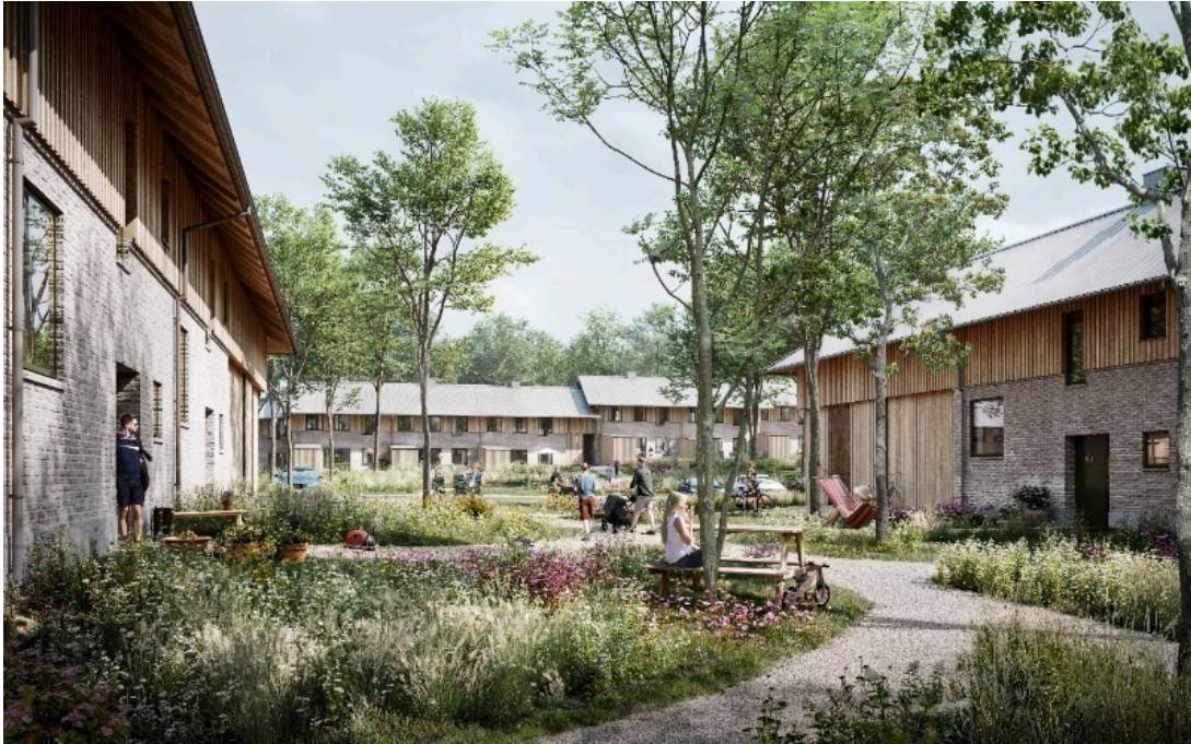
Figur 3: Visualisering af gårdrum.

Tidligere indsigelser vil blive videreført og taget stilling til, i forbindelse med lokalplanens endelige behandling, hvis lokalplanforslaget godkendes til offentlig høring.