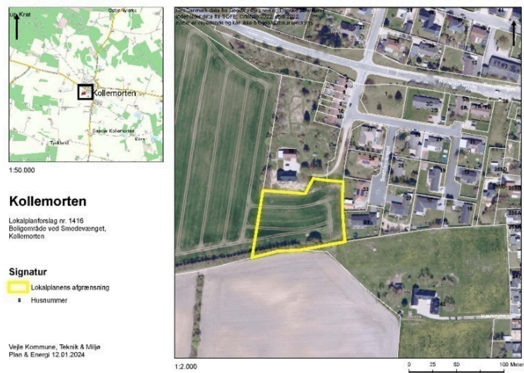
Figur 1: Kort over lokalplanområdet