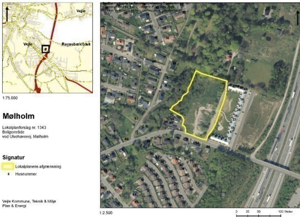
Figur 1: Kort over lokalplanområdet.