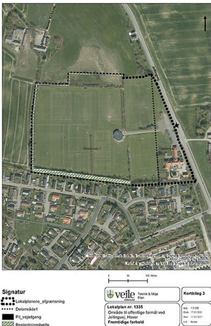
Figur 2: Lokalplanens kortbilag 3, Fremtidige forhold.