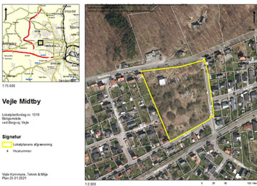
Figur 1: Kort over lokalplanområdet