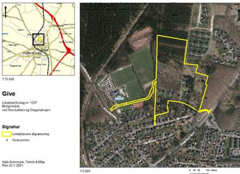
Figur 1: Kort over lokalplanområdet

Teknisk Udvalg besluttede på mødet den 11.8.2020, pkt. nr. 156, at igangsætte udarbejdelse af lokalplan nr. 1327. Der har tidligere været udsendt et forslag til lokalplan nr. 1239 for samme område, men da vejføringer og udstykning er ændret væsentlig er der udarbejdet et nyt lokalplanforslag.