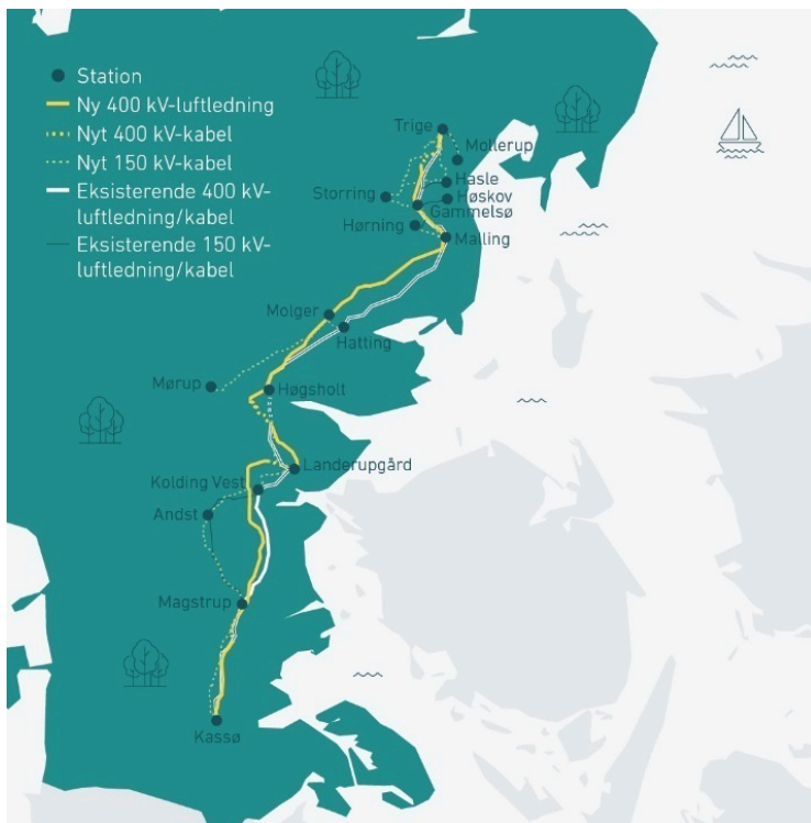
Figur 1: Kort over eksisterende og kommende ledninger

Parallelt gennemføres et særskilt 150 kV-projekt, hvor omkring 270 km luftledninger erstattes af kabler. I Vejle Kommune indebærer det blandt andet en ny transformerstation i Mørup, som kræver lokalplan.