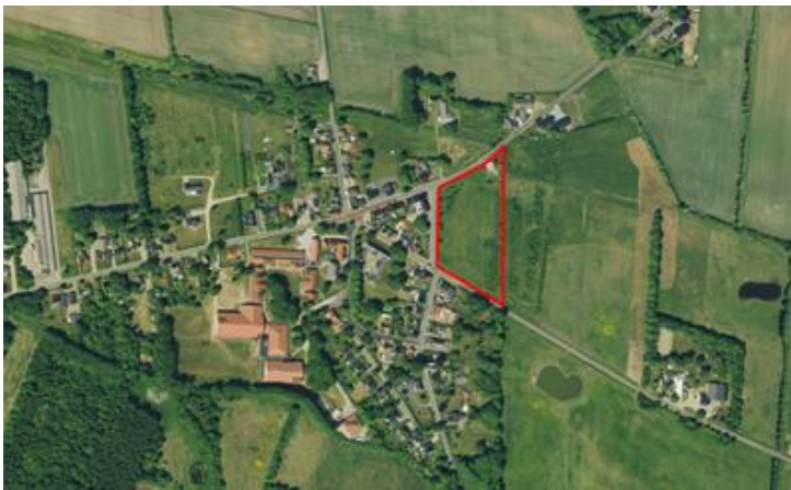
Området i Vesterlund

Det centrale projekt på aktivitetspladsen er et multihus. Multihuset skal være omdrejningspunktet for aktiviteter og fælles arrangementer i landsbyen. Multihuset er hovedsaglig et amfiteater med scene og tilskuerpladser (se BILAG). En stor del af de lokale foreninger bakker op om at ville bruge Multihuset og scenen til at afholde arrangementer og derved skabe mere liv i lokalområdet. Viften af interessenter er meget bred og går fra Efterskolen til menighedsrådet, hvilket vil være med til at gøre aktivitetspladsen til et sted for alle.