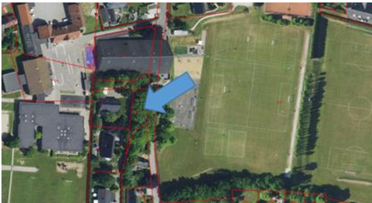
Placering af p-plads

I forbindelse med projektet har Foreningen Gårslevhallen købt en nabogrund på tvangsauktion. Som en del af en helhedsplan ønsker foreningen her at oprette en p-plads, særligt til idrætsudøvere med handicap, så de har let adgang til Gårslevhallen. Projektet kræver ikke en ændring af lokalplaner.