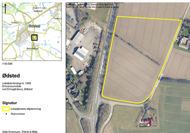
Figur 1: Kort over lokalplanområdet