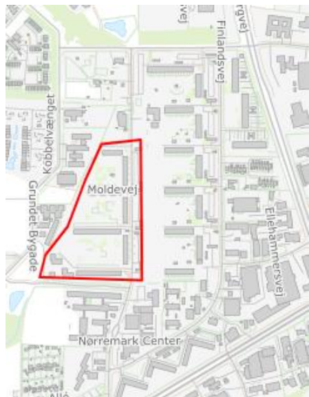
Figur 1: Kort over afd. 18, Moldeparken

ØsterBOs afd. 18, Moldeparken, er beliggende Moldevej 7-75, 7100 Vejle. Afdelingen består af 350 familieboliger og 30 ældreboliger fordelt på 7 blokke.