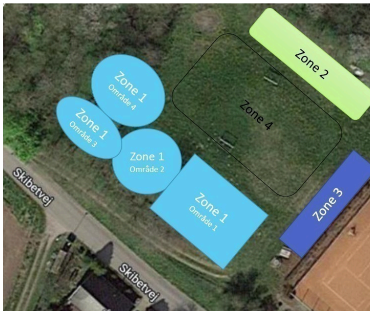
Figur 1: Oversigt over det område, hvor der ansøges om et biodiversitetsområde, i zone 2.

Projektet er en del af et større projekt, der skal udvikle et nyt fælles samlingssted i Nr. Vilstrup. Zone 1, som er en naturlegeplads, fik de støtte til fra Udviklingspuljen d. 24.05.23, pkt. 47. De ansøger nu om midler til at udvikle et biodiversitetsområde i zone 2. Zone 3 som skal være et overdækket opholdsrum ønsker de at udvikle senere. Se oversigtskort med zoner her: