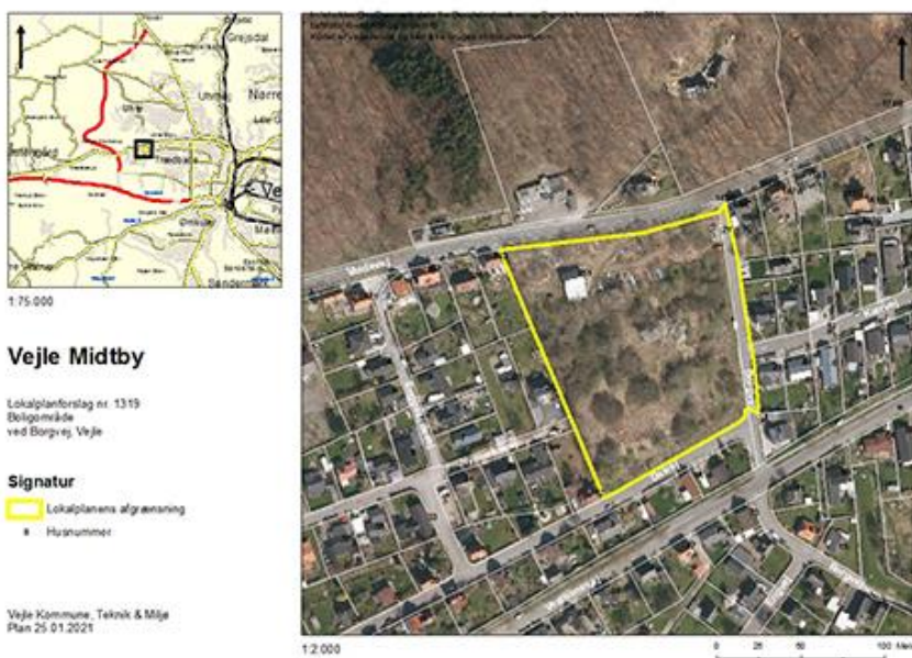
Figur 1: Kort over lokalplanområdet