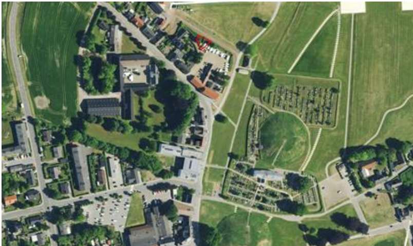
Figur 1: Billede af placering i forhold til monument område

Shelter skal placeres på det grønne areal bag kroen i umiddelbar nærhed til kroens parkeringsplads. Her kan den ugenert etableres, med bænkesæt og bålplads. Der er ligeledes både med offentlige toiletter i nærheden og kroens toiletter.