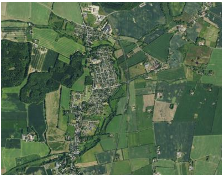
Figur 1: Gravens, Øster Starup og Ågård

Projektet er bundet op på, at skolen spiller en aktiv rolle. Lokalrådet har for at sikre en driftssikker løsning taget kontakt til skolen i håb om, at de vil oprette en ungeredaktion. Ungeredaktionen skal være et valgfag i udkolingen, som skal aktivere og engagere unge i lokalsamfundet. Skolen har tilkendegivet, at de gerne vil oprette et sådant valghold, men der er i skrivende stund ikke afsat midler til projektet fra skolens side.