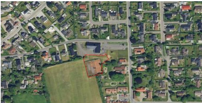
Figur 1: Placering af nye aktiver i bypark

Projektet er et samarbejde mellem Jerlev Sogns Beboerforening, Jerlev Idrætsforening og Jerlev Kulturhus. Projektet udnytter arealer ved Multihytten og Jerlev Kulturhus, samt at det inddrager to nedlagte tennisbaner som et aktiv. I dag ligger de bare hen og bruges ikke. Ligeledes ligger området tæt op ad børnehavens legearealer og sportspladsen i Jerlev.