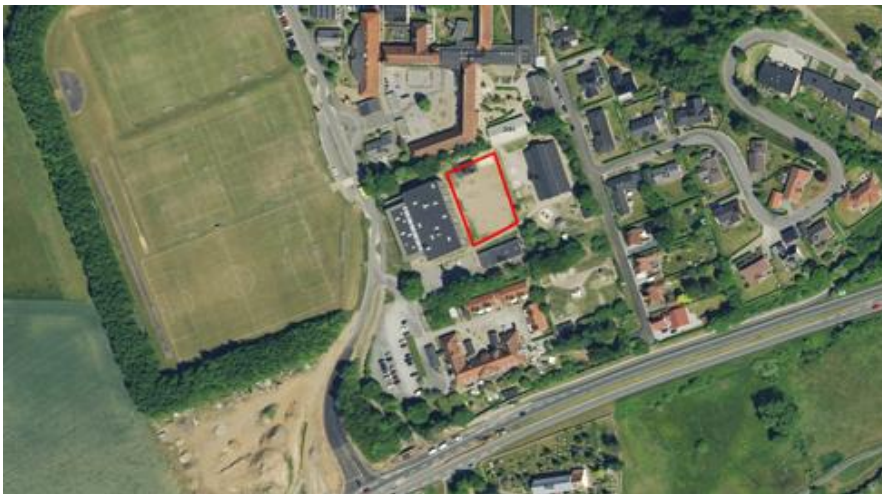
Figur 1: Placering af det nye aktivområde mellem hal og skole

Skibetområdet har tilflytning, og skolen og hallen skal gerne være det samlende sted for alle i lokaleområdet. Det vil dette nye område bidrage til.