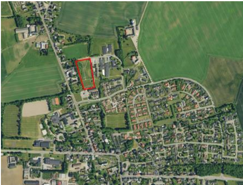
Figur 1: Placering af Bredsten Bypark

Bredsten i Udvikling vandt i 2017 den store idé med deres projekt "Den røde tråd". I forbindelse med realisering af projektet blev der lavet store kørespor af de maskiner, der havde til opgave at etablere en Tarzan / motionsbane i byparken. Bredsten i Udvikling har på eget initiativ ført området tilbage til tidligere stand.