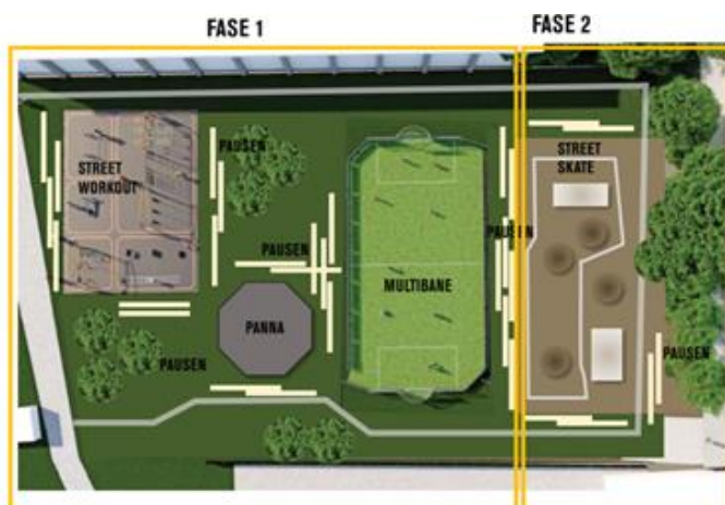
Figur 2: Billede af projektets to faser