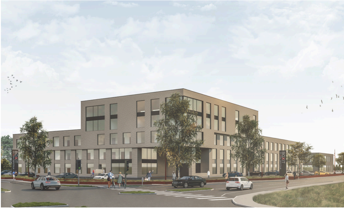
Figur 2: Illustration, set fra syd mod nord ved Toldbodvej og IbÅk Strandvej