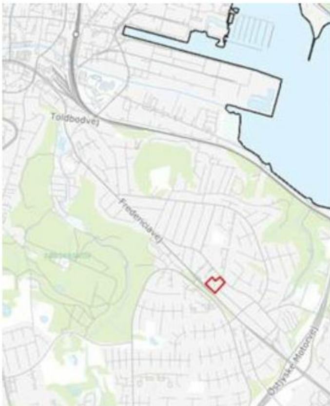
Figur 1: Kort over afd. 8712, Mølholm Have