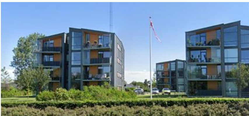
Figur 2: Afd. 8712, Mølholm Landevej 20A-20F, 7100 Vejle.

Domea Vejle-Børkop har over en længere periode været i dialog med Byggeskadefonden vedrørende vandindtrængning ved vinduespartier. Byggeskadefonden har nu anerkendt, at bygningskaden, som giver vandindtrængen i boligerne, er dækningsberettiget.