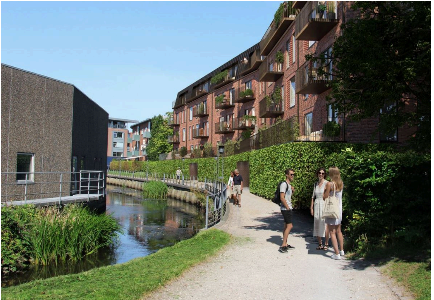
Figur 2. Visualisering af ny bebyggelse set fra Omløbsåen