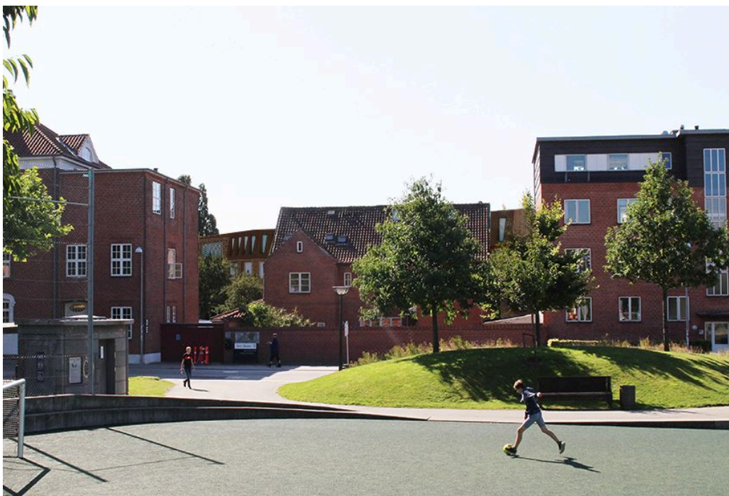
Figur 3. Visualisering af bebyggelse set fra Mariaparken (bag eksisterende bebyggelse)