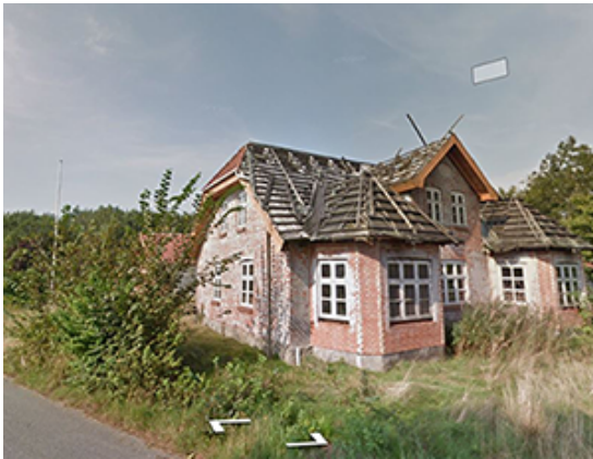
Figur 1: Foto af ejendommen

Ejendommen opfylder de kriterier, som udvalget har fastlagt. Den ligger ud til landsbyens hovedgade og er skæmmende. Den har gennem en årrække stået tom efter at en tidligere ejer måtte opgive en påbegyndt ombygning, og har siden skiftet hænder flere gange. På grund af den uafsluttede ombygning er den i dag en ruin.