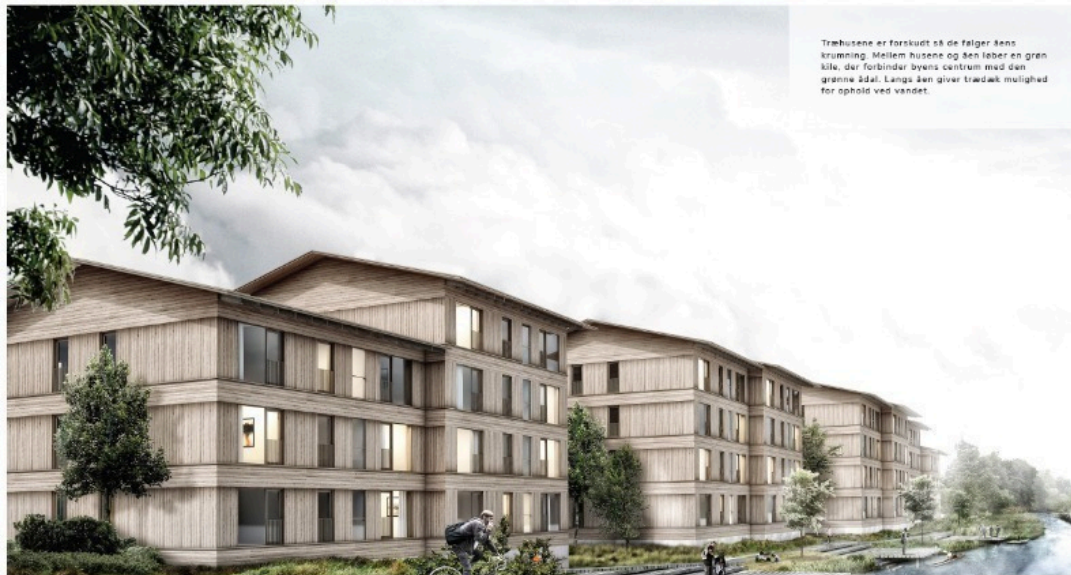
Fig. 3. Skitse der illustrerer punkthusenes facade med træbeklædning og placering langs Åen

Boligerne får et boligareal på mellem 34 - 106 m 2 . Boligerne til udsatte unge får et boligareal på ca. 34 m 2 og indrettes med fast inventar, så beboeren ikke nødvendigvis skal medbringe møbler eller andet til indretning af lejligheden.