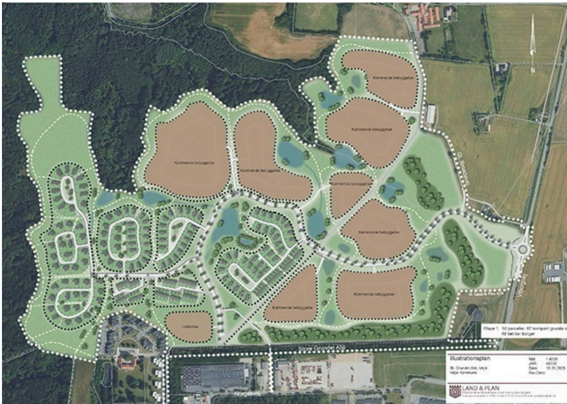
Figur 2: Bebyggelsesplan for lokalplanområdet viser bebyggelse i første etape og markering af fremtidig etape.