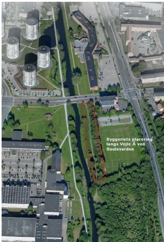
Fig. 1. Oversigtsfoto med markering af byggeriets placering langs Vejle Å...