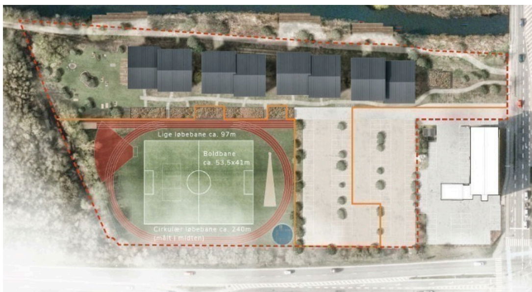
Fig. 2. Oversigtsfoto med punkthusenes placering