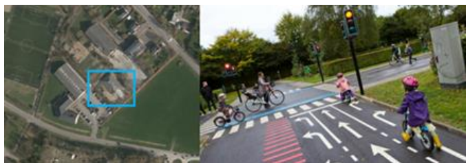
Placering i Givskud

Der skal optegnes vejbaner, og der skal indkøbes skiltesæt.