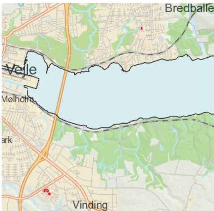
Figur 1 - Oversigtskort over boligerne i afd. 112-02 er beliggende.

Vejle Ældreboligselskab (v/ Domea.dk) anmoder kommunen om godkendelse af tagrenovering i afdeling 112-02. Renoveringen medfører optagelse af kreditforeningslån med kommunegaranti samt brug af afdelingens henlæggelser. Afdelingen består af 28 boliger, som er beliggende på Emil Reesens Vej, H C Lumbyes Vej og Niels W Gades Vej, 7100 Vejle ,og 5 boliger som er beliggende på Grønbotoftevej 7120 Vejle Øst.