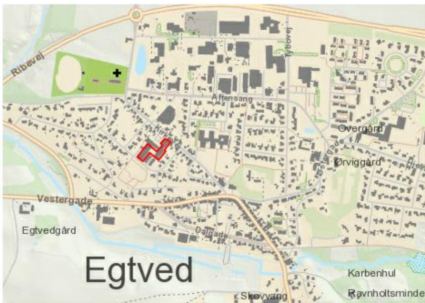
Figur 1: Oversigtskort over hvor Kirkevej 21A-E er beliggende.

Domea Egtved anmoder kommunen om godkendelse af tagreovering i afdeling 8851. Tagreoveringen omfatter ældreboligerne på Kirkevej 21A-E, Egtved. Renoveringen vil medføre optagelse af kreditforeningslån med behov for kommunegaranti samt huslejestigning. Afdeling 8851 består af 295 familieboliger, 15 ungdomsboliger og 10 ældreboliger.