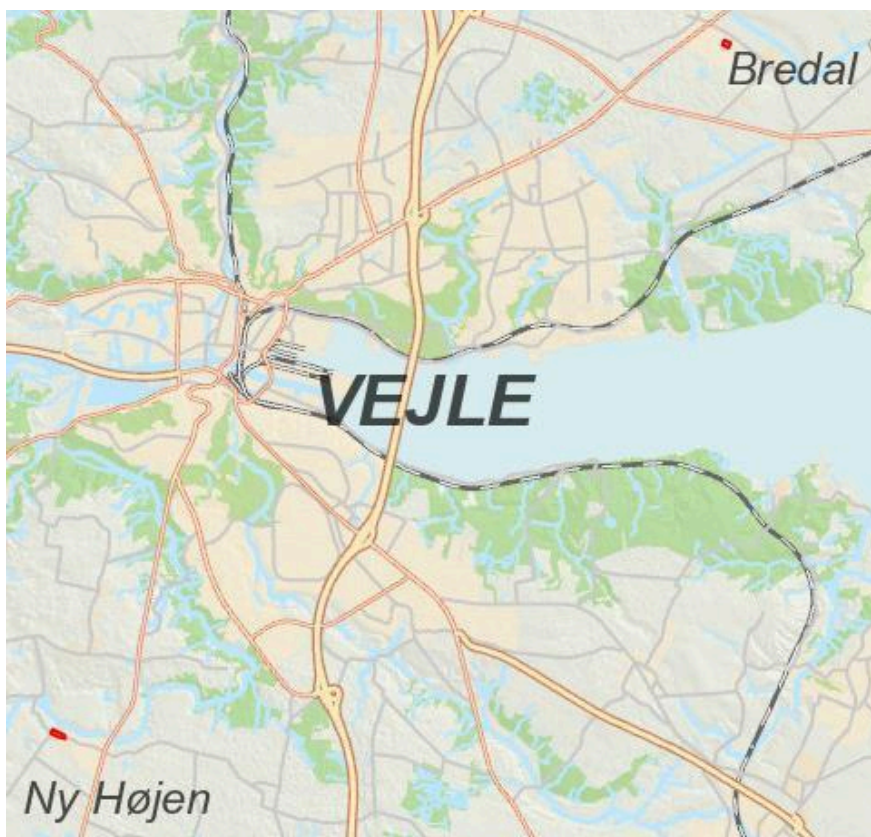
Figur 1 - Kort over placering af afdelingerne i kommunen

Domea Vejle-Børkop anmoder om godkendelse af skema B for en større reovering af boliger i afd. 8705, Bredal, og afd. 8706, Ny Højen. Anlægssummen ved skema B er 13.556.281 kr.. Byrådet godkendte den 19. juni 2019 i pkt. 145 skema A med en samlet anlægssum på 13.601.685 kr.