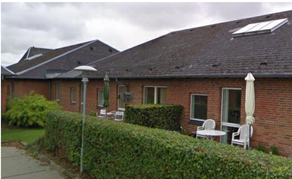
Figur 2: Billede af en bolig på Kirkevej.

Beboerne har på et afdelingsmøde den 4. februar 2020 godkendt tagreoveringen på Kirkevej 21A-E.