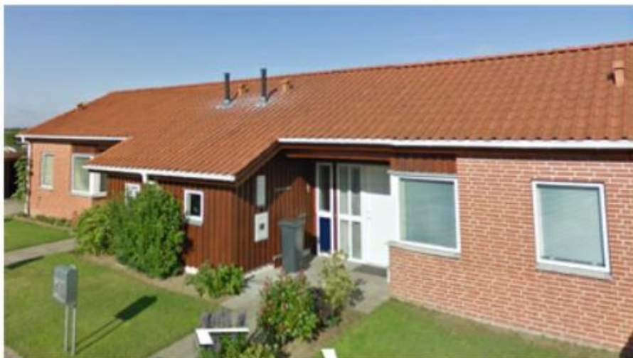
Figur 2 - Billede af en bolig i afd. 112-02.

Beboerne har på et ekstraordinært afdelingsmøde den 18. december 2019 godkendt tagrenoveringen.