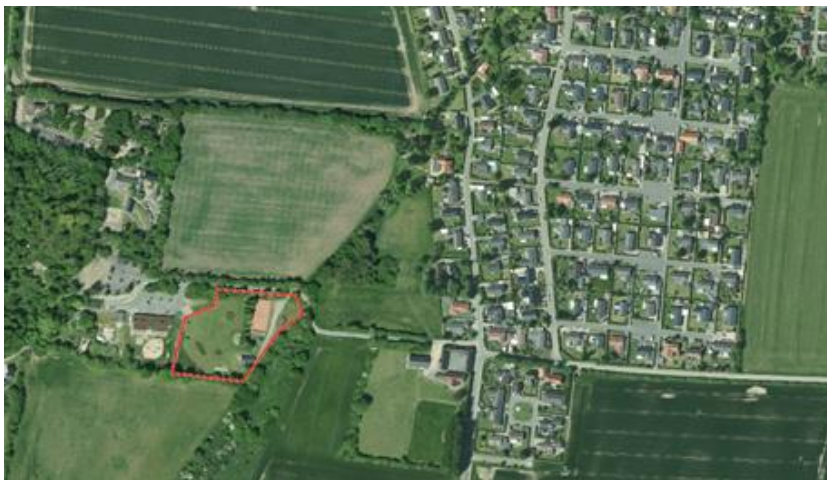
Figur 1: Oversigtskort

Borgerforeningen fremlagde ønsker til puljen til realisering af by visionen og fik tildelt 150.000 kr. til projektet klatrevæg på aktivitetsområdet. Senere undersøgelser af undergrunden har dog gjort at projektet er blevet dyrere at realisere end først antaget, da området hvor stenene skal stå, skal drænes.