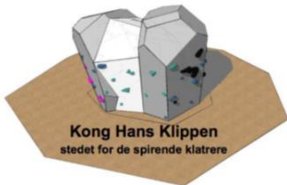
Figur 2: Kong Hans Klippen

Titlen på projektet er Kong Hans Klippen. Kong Hans Klippen er en unik klatrelegeplads, der henvender sig til de unge. Klatreklippen etableres på Skærup Lege- og Aktivitetspark og supplerer de allerede etablerede aktiviteter.