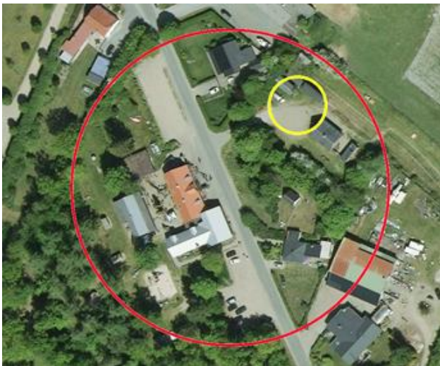
Figur 1: Oversigtskort

Bindeballe Stations Venner vil gerne etablere et overdækket område med information, oplevelsesværksted og udstillinger til de mange besøgende. Tilbygningen skal placeres i forlængelse af den eksisterende bygning "Kul-huset", og den skal hedde "Kryb-i-læ". Bindeballe Stations Venner ønsker at det overdækkede område skal kunne rumme flere funktioner, til gavn for besøgende. Der skal udstilles forskellige udgaver af historiske transportvogne. Der skal være information om kyst til kyst stien og om Bindeballestien, for at sætte Bindeballe i en større sammenhæng. Og der skal laves en cykel servicestation og et madpakkehus til de mange besøgende.