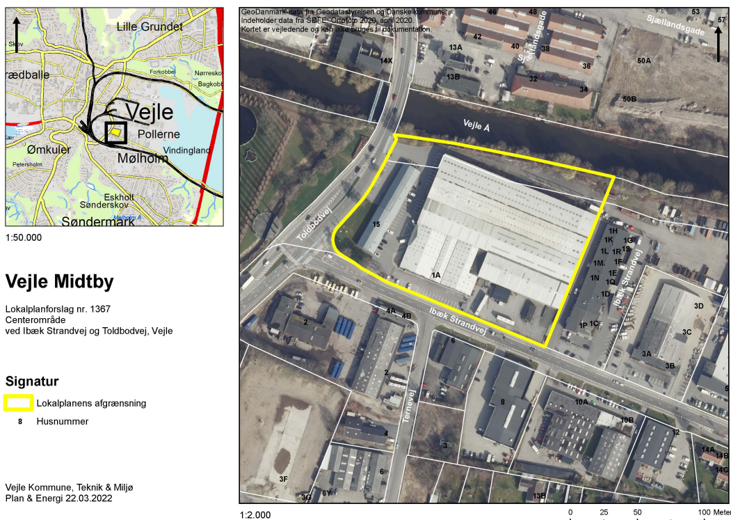
Figur 1: Kort over lokalplanområdet