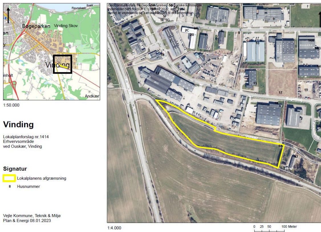
Figur 1: Kort over lokalplanområdet