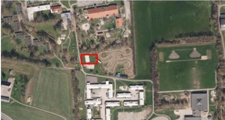
Ragnarok Skatepark, Jelling

Det er et ønske fra Ragnarok, at et besøg på stedet skal være en oplevelse, også selvom man ikke skater, og med en placering fem minutter fra Byens Hus kan området bruges som et aktiv i forhold til kulturelle arrangementer i byen.