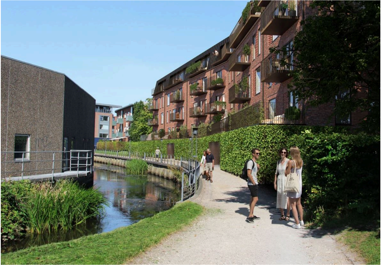
Figur 2. Visualisering af ny bebyggelse set fra Omløbsåen