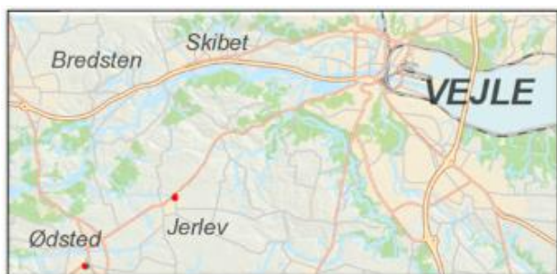
Jerlev Boulevard 12-26, Jerlev