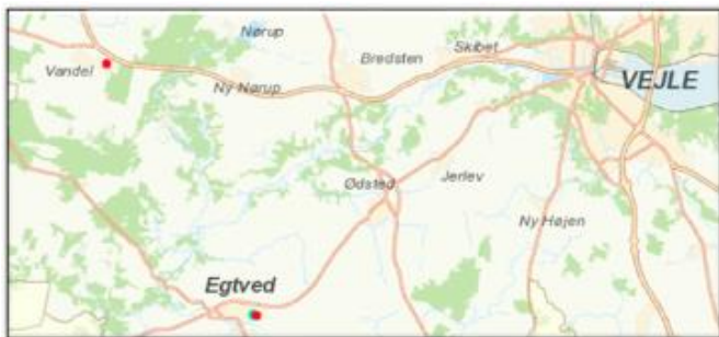
Hjelmstrupvej 17-57, Egtved